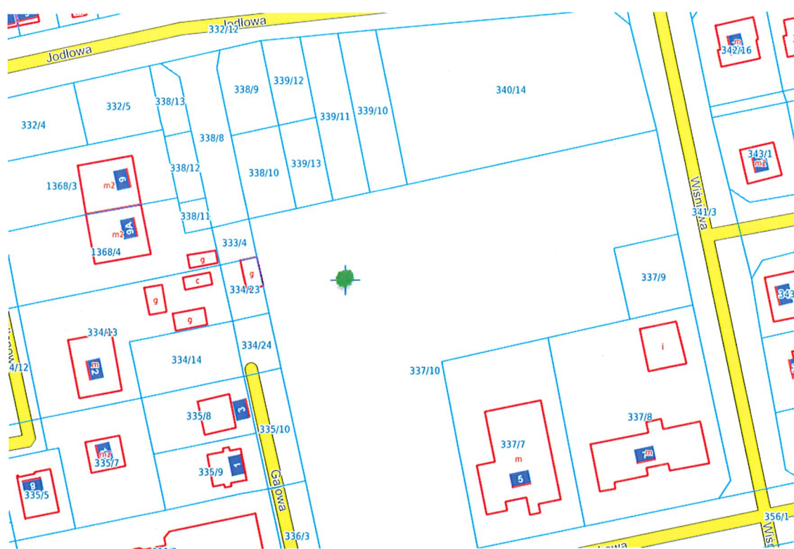
Ryc. 2. Lokalizacja klonu jawnego (CRFOP: PL.ZIPOP.1393.PP.2215011.7994)