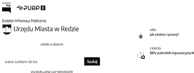
Rys 3. Informacja o konsultacjach na stronie Biuletynu Informacji Publicznej Miasta Reda